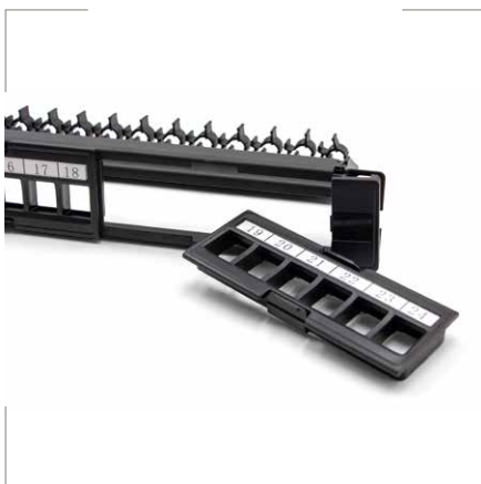
UTP 24 puertos