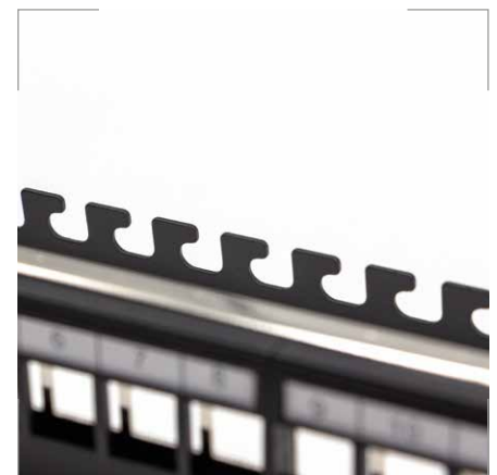
STP 24 puertos