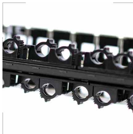
STP 48 puertos